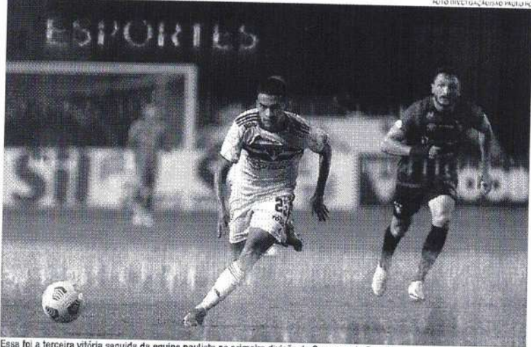
Essa foi a terceira vitória seguida da equipe paulista na primeira divisão do Campeonato Brasileiro

Na primeira partida contra o meio-campista, pertencente atualmente ao Leão da Ilha, o tricolor venceu por 1 a 0, em jogo válido pelo Brasileiro